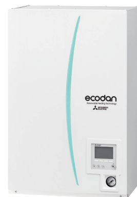
Тепловые насосы (наружные агрегаты)